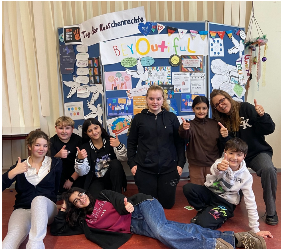
Abbildung 1: Unsere Stellwand zum Tag der Menschenrechte