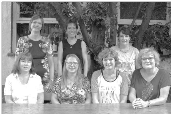
Mitglieder des Vorstandes

Auf der Suche nach neuen Mitgliedern ist der Förderverein der Realschule Neckargemünd, für den ich hier ausdrücklich Werbung machen möchte! Die Mitgliedschaft und die Mitarbeit im Verein ist von einem sehr freundlichen Umgang geprägt.